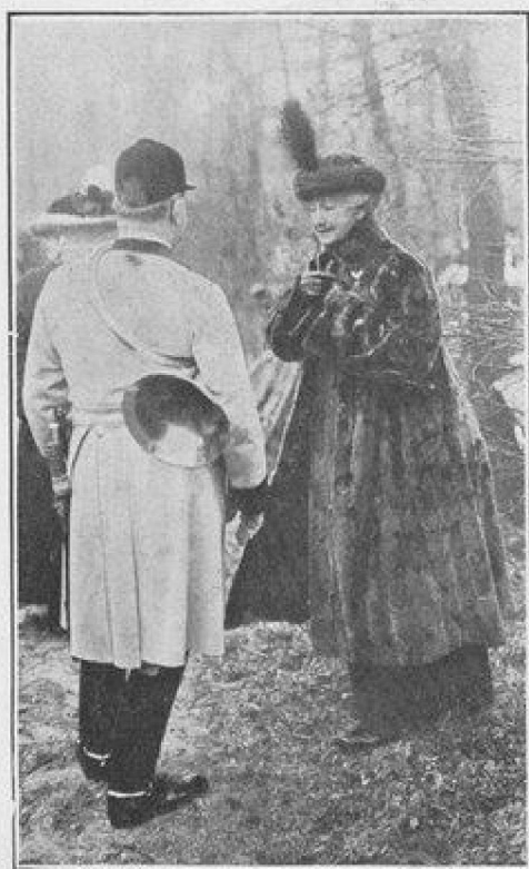
S. A. R. LA DUCHESSE DE CHARTRES AU RENDEZ-VOUS

les membres secs et nerveux, les têtes sont expressives, deux points de feu sont placés au-dessus des yeux... ce sont là des marques de la vieille race de Saintonge. Des étalons bien choisis ont su transmettre l'ancien type : Diligent, entre autres, avait toutes les qualités du bon reproducteur. Cotillon, joli chien du chenil Béjarry, a été utilisé également. Un chien anglais, Wattmann, a donné des produits réussis, tels qu'Organo, de qui descend Quinquina, grand beau chien tricolore qui, tout en accusant un degré de sang anglais assez avancé, a conservé les belles qualités du bâtard bien racé et surtout une tête allongée, ornée de pendants bien plantés ; quelques-uns de ses frères ou cousins du côté paternel sont moins réussis sous ce rapport. La tête du bâtard décele toujours son origine, bonne ou mauvaise ; aussi doit-on s'efforcer d'obtenir dans l'élevage des têtes typiques rappelant la race que l'on veut