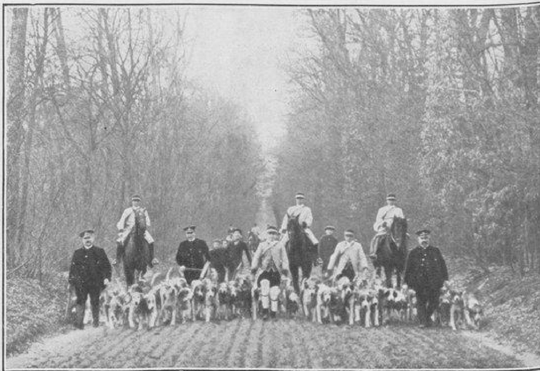
LA MEUTE DU RALLYE-CHAMBLY

maintenir, comme celle d'un joli chien, Brin d'Amour, blanc et noir, qui a toutes les qualités du saintongeais. Rappelant le type du Haut-Poitou, une séduisante petite chienne tricolore, appelée Rosière, sœur d'un beau chien dénommé Négociant, attire l'attention avec sa tête fine au nez busqué, elle a la mine futée d'une belette.