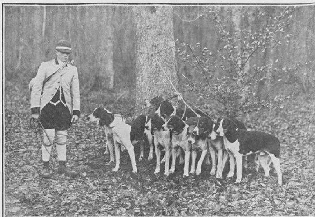
UN RELAI EN FORÊT DE CHANTILLY

Si les chiens sont plaisants à voir au chenil, l'impression qu'ils donnent en chasse n'est pas moins bonne ; ils font de la belle musique, leur menée est gaie et brillante. Quelle joie pour un veneur de galoper sur un vigoureux hunter dans ces belles allées de Chantilly, de pouvoir se tenir toujours près des chiens, de juger leur travail, leur menée plus ou moins chaude, selon que l'animal de chasse est seul ou accompagné ; la forêt de Chantilly étant très vive, il y faut des chiens créancés à fond, et c'est merveilleux de voir à quel degré de sagesse arrivent les meilleurs ; ils ne font même pas attention au change qui bondit sous leur nez, démêlent seuls leur cerf dans les hardes les plus nombreuses. L'assistance très nombreuse cause parfois de l'embarras... Néanmoins, à Chantilly, on ne