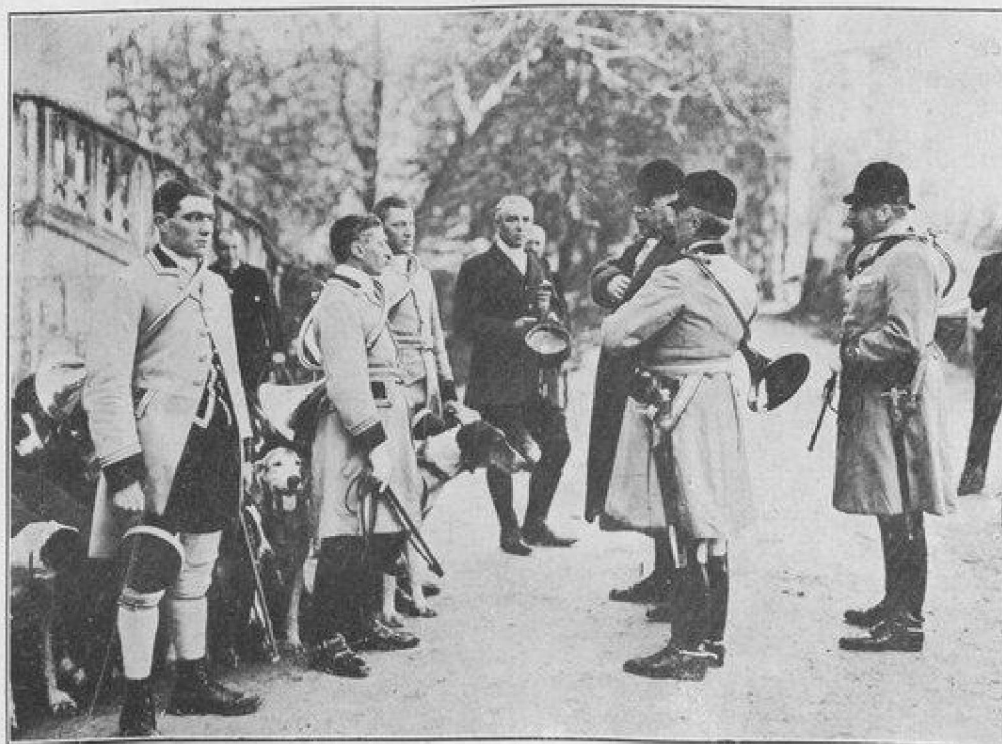
RAPPORT DU PIQUEUX AUX MAÎTRES D'ÉQUIPAGE

Aujourd'hui, quatre-vingts bâtards saintongeois et poitevins-saintongeois garnissent les bancs des chenils... la plupart des chiens du prince Murat rappellent beaucoup le type si aristocratique des chiens du chevalier de Béjarry, un grand connaisseur en matière d'élevage : comme les chiens du veneur vendéen, ceux du Rallye-Chambly sont blancs, à manteau noir, de grande taille, légers sans être grêles, la charpente est solide, les lignes régulières,